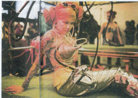
Aan ziekenhuisbedden vastgebonden meisjes laten hun moedermelk afkoken. Performance van de Neverporn Community uit Sint Petersburg in de Gashouder.